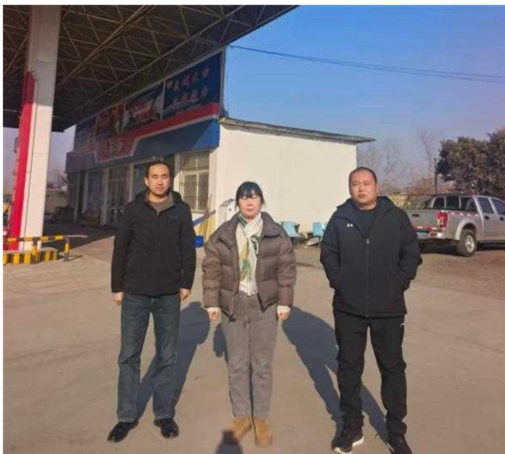
菏泽市牡丹区鑫顺加油站现场照片