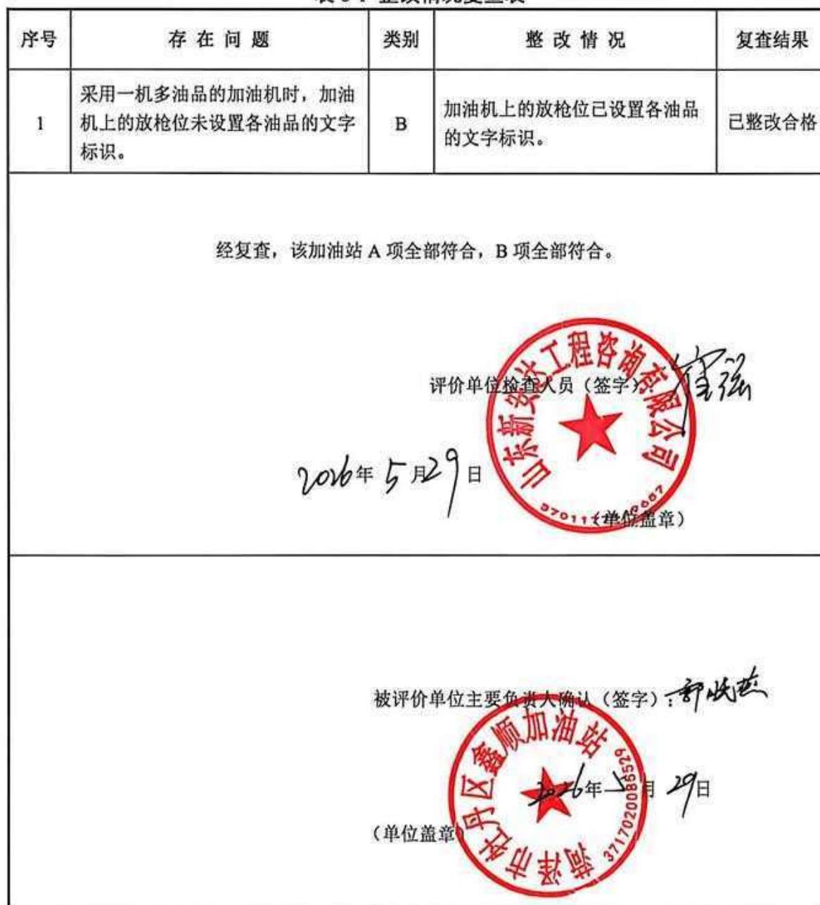
表 8-1 整改情况复查表