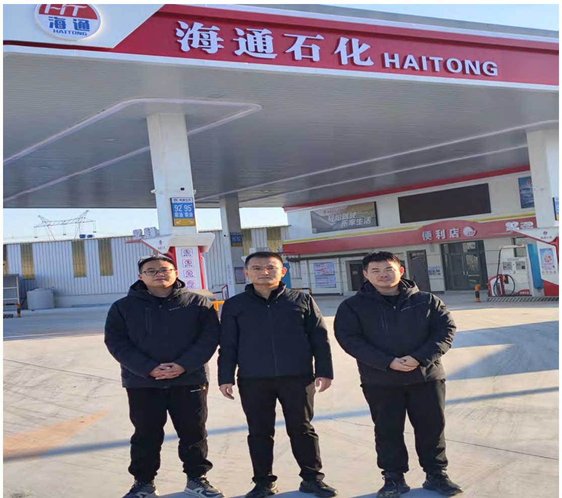
富海能源有限公司高新区海通加油站现场照片