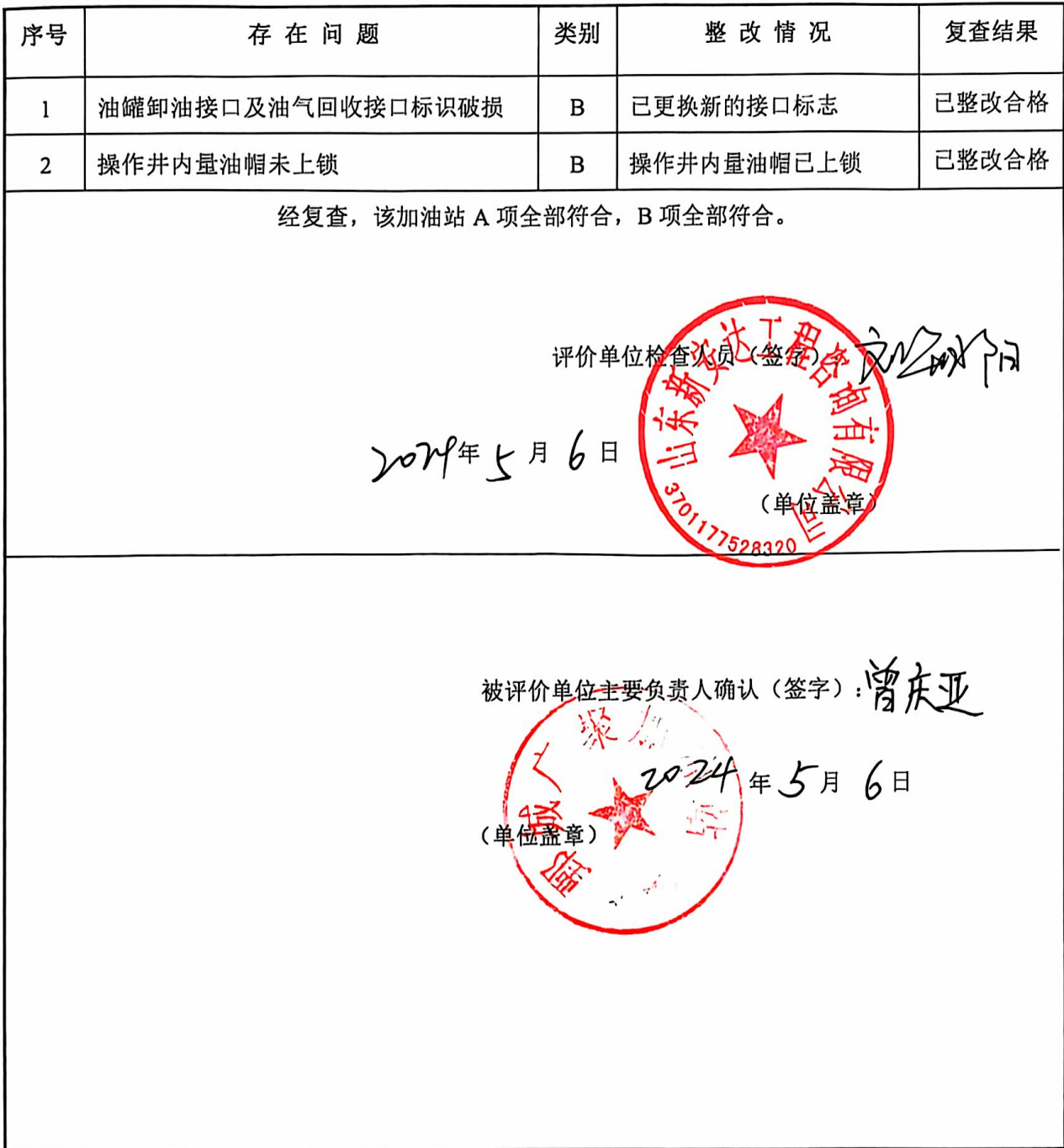
表 8-1 整改情況復查表