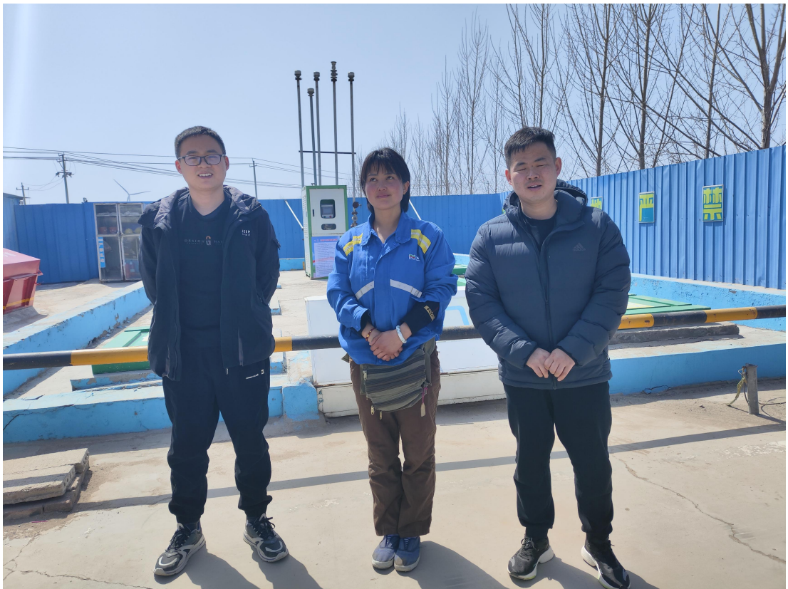
鄆城广聚加油站现场照片