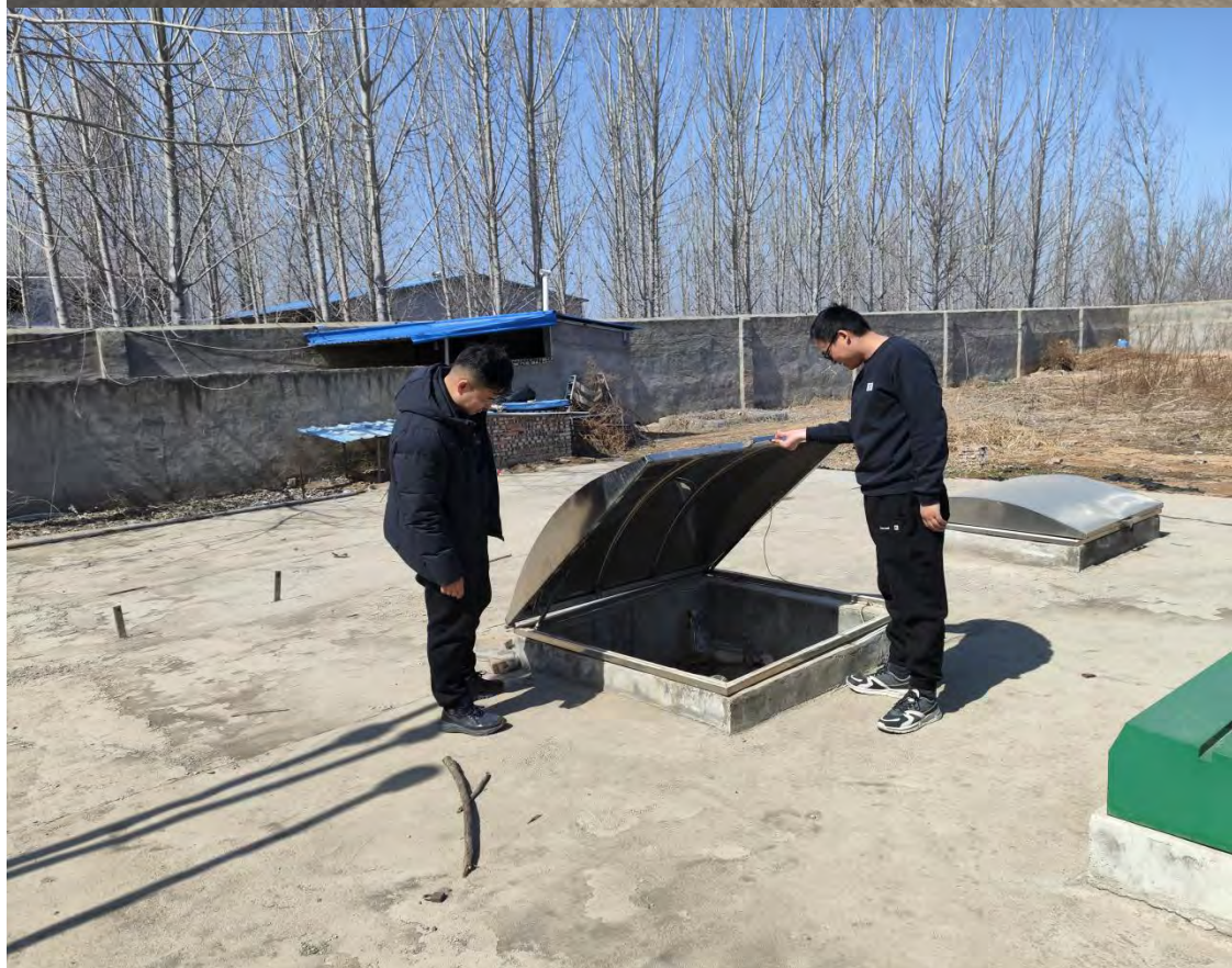
曹县苏集宏鑫加油站现场照片